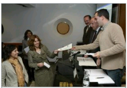
AYUDAS DE HASTA 6.000 EUROS. Las concede la OTRI.

Los investigadores de la Universidad de Granada (UGR) quieren que sus trabajos tengan el mayor rendimiento posible y la institución universitaria está haciendo un esfuerzo interesante para que así sea. A través del Programa de Ayudas a la Transferencia de Investigación de la UGR se han impulsado cinco proyectos empresariales de base tecnológica. Las empresas beneficiadas son Entrenatech S.L., Iactive Intelligent Solutions S.L., Seven Solution S.L., Optima Soft Sociedad Coop. Andaluza y Vitagenes S.L.